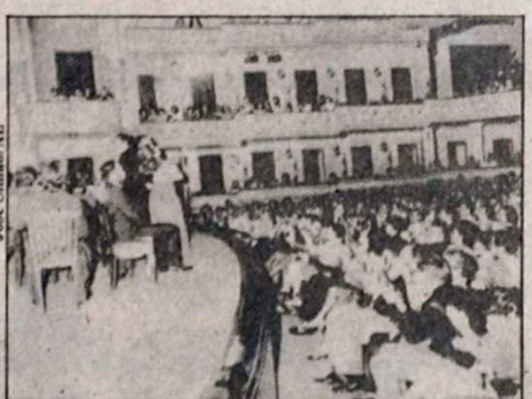
No Rio, um grande sucesso. Repetido aqui.

Andrea Chénier foi até agora o espetáculo mais vibrante da temporada lírica de 89. A música apaixonada de Giordano imediatamente aqueceu o público que lotava o Municipal na segunda-feira à noite. Aprile Millo já é uma favorita entre os paulistanos, e ao entrar em cena foi saudado com aplausos. Ao final de sua grande ária do terceiro ato, "La Mamma Morta", ela foi histericamente ovacionada. A voz ampla e sonora continua redonda e rica e a cantora demonstrou ainda preocupação e habilidade em controlar um fraseado delicado e bem acabado, sem se restringir a um mero exibicionismo de potência. Dramaticamente, foi uma Madalena sincera e espontânea.